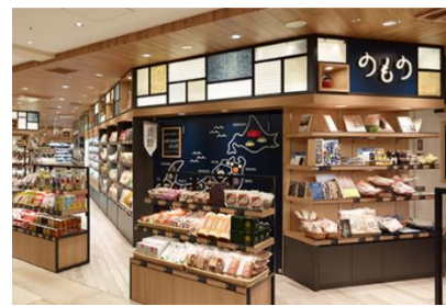
のもの東京駅グランスタ丸の内店